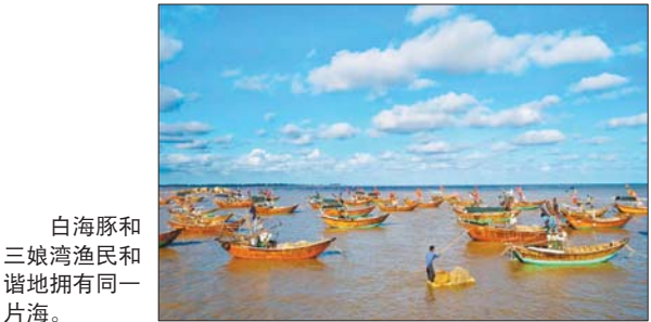
白海豚和三娘湾渔民和谐地拥有同一片海。