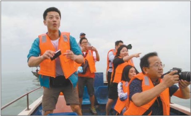
看海豚、拍海豚成为三娘湾特色游。