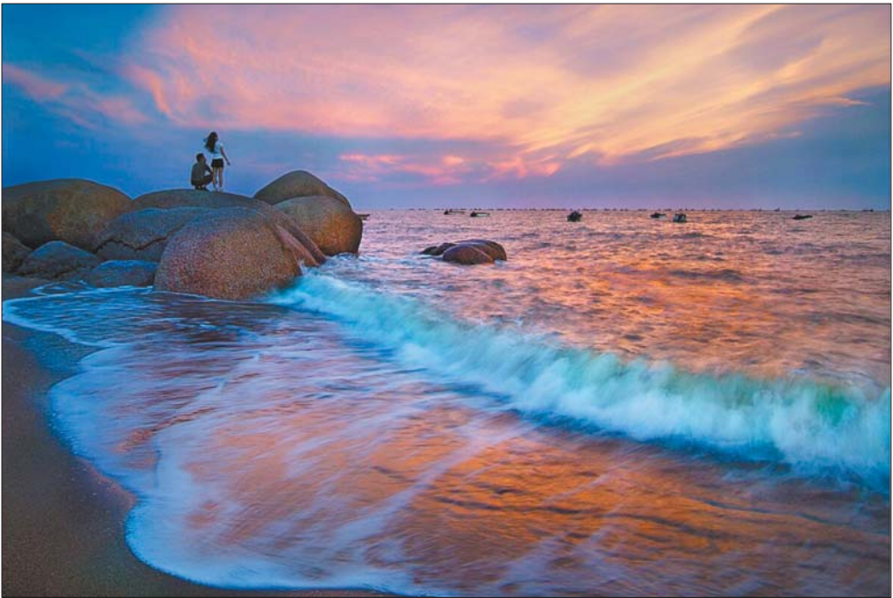
一抹晚霞为三娘湾增添浓郁的浪漫情调。