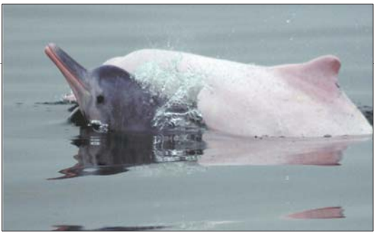
皮肤呈深灰色的幼年海豚。