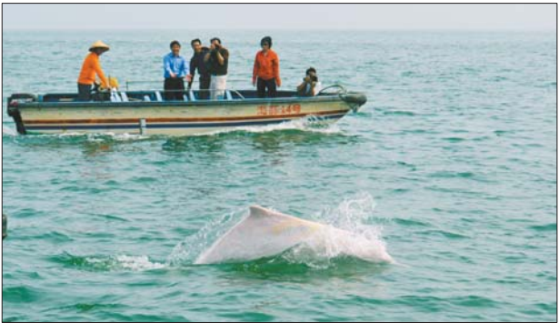
中华白海豚像是和游客嬉戏。

它像是与游人嬉戏,忽而船舷、忽而船头,惊呼声、快门声遮住了海浪声。海上这短短的十分钟却让我们兴奋不已。听当地人讲,在这片海域里,常年活跃着近两百只五彩斑斓的中华白海豚,而且一年四季都能近距离观看,每当渔民出海捕鱼或游人出海观光时,海豚常常追逐渔船、逗游客,或在海中自由嬉戏。 看着眼前的一切,我又重拾这片静静的海湾,掩映在枝繁叶茂的红树林里的海滩洁白柔软,千姿百态的礁石巍然屹立,古朴的渔村温馨而恬淡,灵动的海豚亲切的呼唤,还有那悠闲从容的渔民……这一切让我坚信,这是世间不可多得的温馨,像童话般纯净。