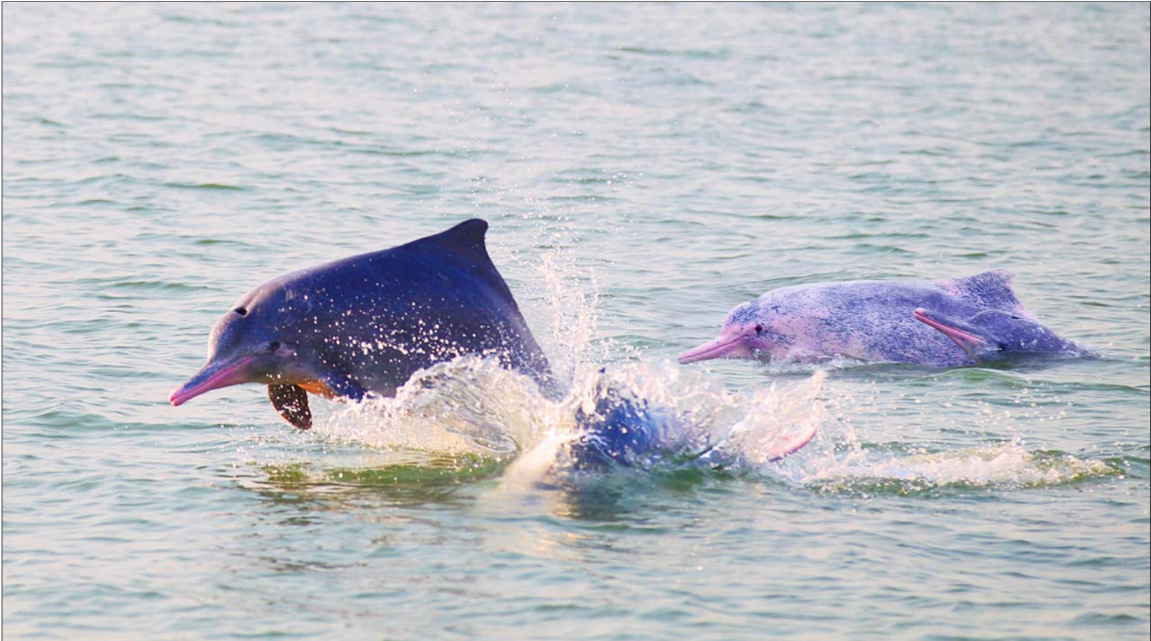
三娘湾中成群的中华白海豚。