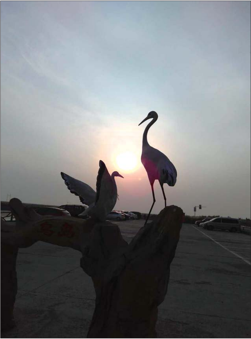
文化东路社区 王静 作品