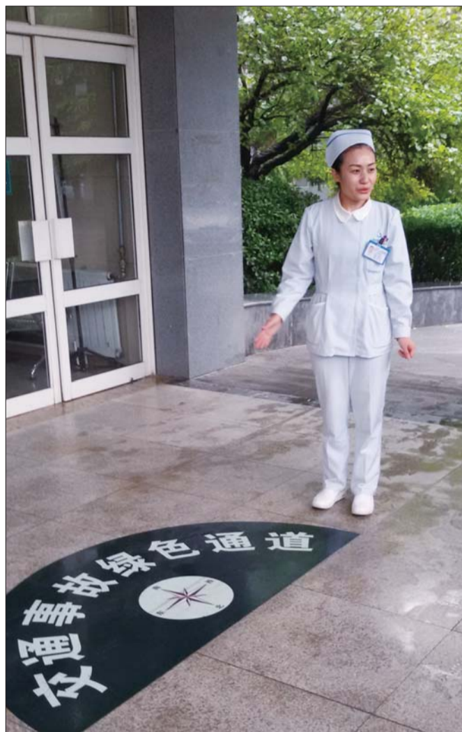
省立医院西院为交通事故伤者开辟绿色通道。

据了解,截至目前,省立医院西院已经先后为45起事故的伤者申请救助基金,先后垫付了119多万元治疗费用,其中部分已经由救助基金支付返还,部分还在申请之中。