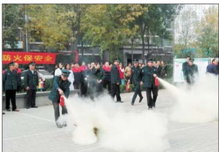
▲进入冬季,部分社区举行消防安全演习,普及消防知识。