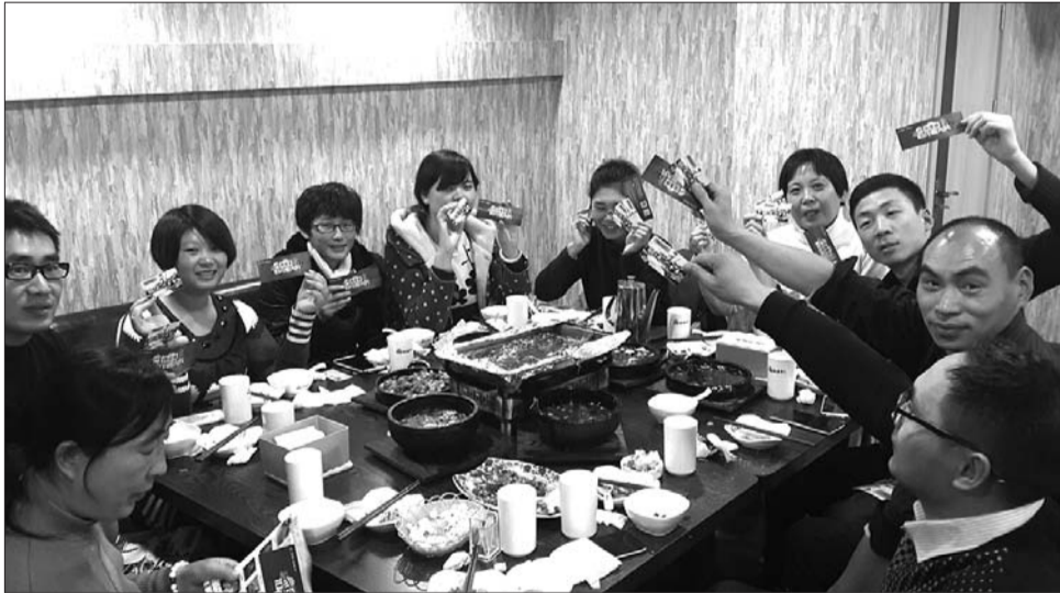
餐厅掌柜还为吃货们送上电影票、优惠券(哎哟,不错哦)。

也是我能接受的。石锅毛血旺也挺好吃的,和平时吃的毛血旺略有不同,是老板改良过的,里面有花蛤。当然,我最喜欢的是石锅泰式虾。这道菜不光虾好吃,就连打底的白菜也很好吃。我能说我们只差没把汁喝光了。总