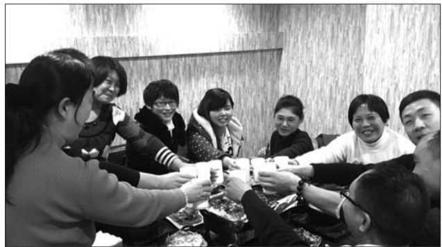
大家一起碰个杯!吃起来!

现场好评如潮,几乎每一道新菜都是掌声一片。各路吃货大显神通,美食一被端上就被抢吃一空。“我比较喜欢特色麻辣烤鱼,真的是非常棒!鱼肉很嫩,我很喜欢这种烤鱼。还有它的辣度