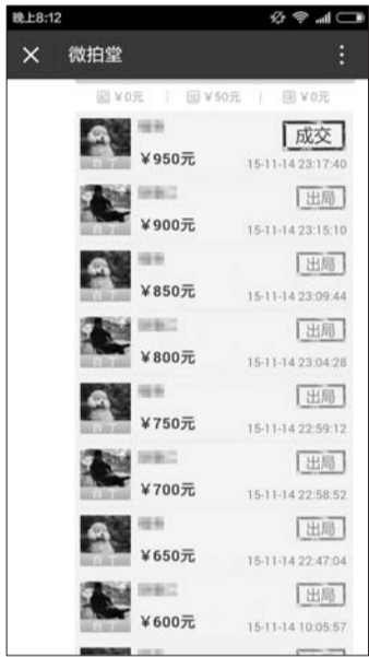
一件藏品,两个藏友20分钟内7次激烈竞价。