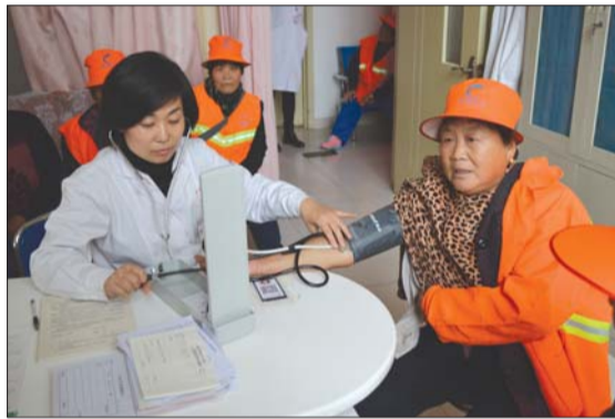
医生正为一名环卫工量血压。

本次体检项目分为内科、心电图、b超、血常规等12余项检查,每天控制在50人以内,爱心医院将为