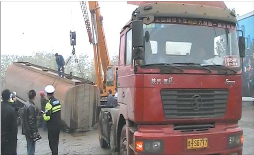
油罐车泄漏出大量散发着刺鼻气味的液体。 视频截图