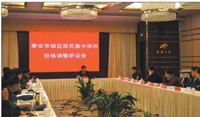
17日，泰安举行供暖价格调整听证会。本报记者 陈新 摄

17日，泰安市城区居民集中供热价格调整听证会在东岳山庄举办，前期方案拟每平方米下调2.2元，参与会议的8位消费者代表中7位认为下调2.2元太少，应加大降价幅度。