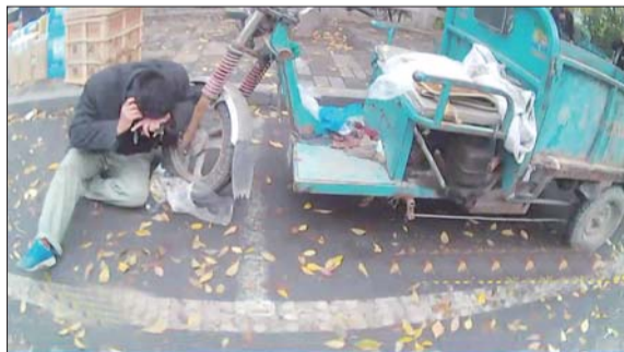
刘某死死抱住三轮车不放手。 视频截图

几分钟后,刘某突然离开了三轮车,翻过东工商河护栏,在河岸边又打起了电话。最后,刘某挂断了电话,开始脱掉身