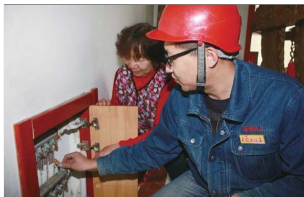
热电工作人员为居民维修暖气片。

对此,记者联系到华星热力,一相关负责人介绍,今年南家小区和鑫盛阳光丽舍小区都把供暖移交给公司,但是因为移交的比较晚,工作人员接收时发现,小区的供暖设备都十分陈