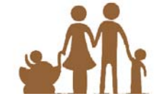
二孩时代之 高龄产妇