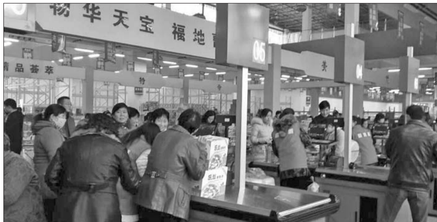
11月16日开幕的第四届曹县物资交流会在喜地国际物流园举办,消费者在抢购产品。

记者在菏泽曹县了解到,当地通过整合农产品、生产商、供应商、经销商于统一物流大平台,利用云计算和大数据分析,为生产企业提供采购、供应、产品展销、市场渠道拓展、供应链物流服务、供应链金融服务等全程化综合服务,降低其生产成本、流通成本、资金成本,通过“互联网+供应链物流”商业新模式,打造鲁西南最前沿的“线上交易、线下集散”的双平台物流高地,来促进传统产业升级。