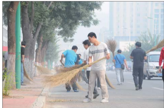
城乡建设局职工上街义务劳动。(资料图)

工程项目部围挡要严格按照50%公益广告比例进行喷绘,其中13家项目部同意交由主管部门统一进行喷绘制作,13家项目部要求自行喷绘。截至目前,公益广告喷绘布已基本制作完成,12日下午已对13家项目部围挡进行统一安装;另外13家项目部项目也在按照计划进行中。为确保完成所有在建项目围挡喷绘任务,城乡建设局安排专人对围挡喷绘进度进行全程跟进,责任到人。