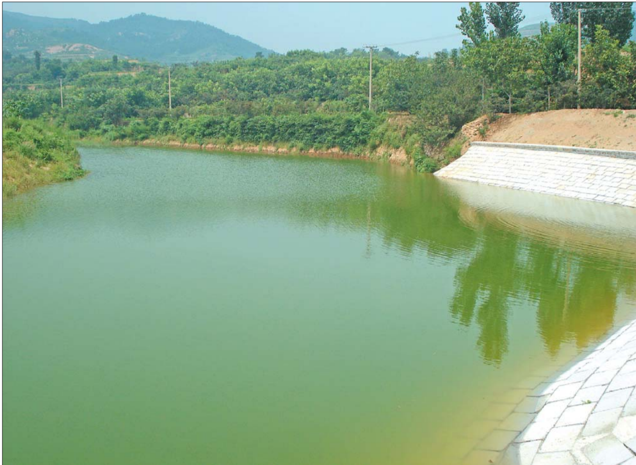
书堂峪小塘坝(资料片)

大多数人认同的说法是,这是穆桂英手下的一名将军化而为此石,因为在书堂峪的南侧不远处是穆柯寨——穆桂英的老家。村民们认为,当年,穆桂英跟随杨宗保下山之后,留下了一部分人把守穆柯寨,其中的一位将军负责书堂峪的守卫。这位将军忠于职守,日夜守卫在这里,千百年后,就变作一块大石头,依旧守在山梁上。