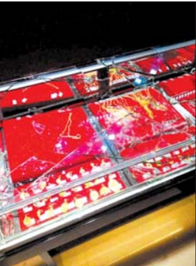
▲店内多个首饰柜台被砸烂。