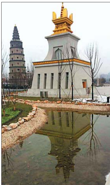
三等奖 作者 于海霞 奖励价值150元奖品