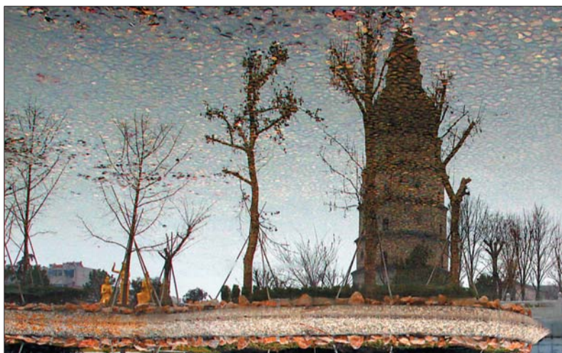
二等奖 作者 杨维国 奖励价值300元奖品