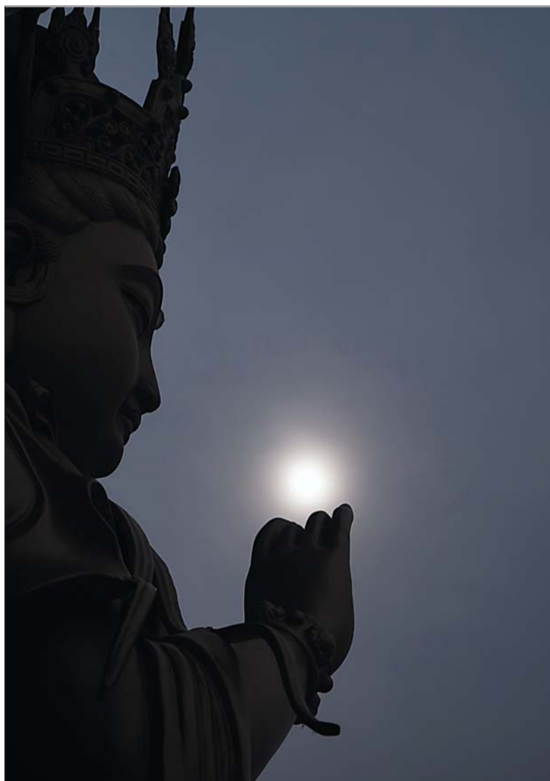
一等奖 作者 高艳 奖励价值500元奖品