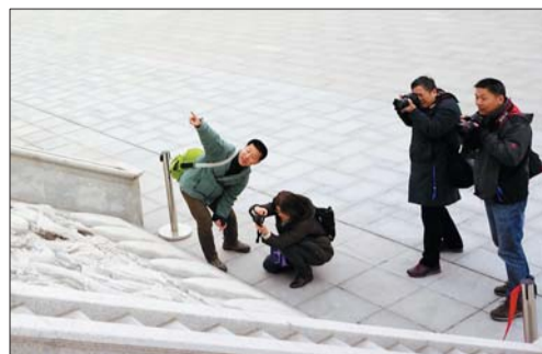
本报摄影记者现场指导,指哪拍哪。