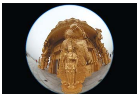
优秀奖 作者 吕霞