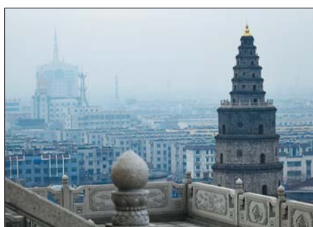
三等奖 作者 赵益军 奖励价值150元奖品