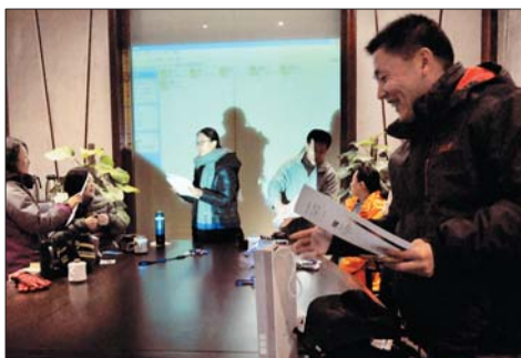
拿到获奖证书,开心!