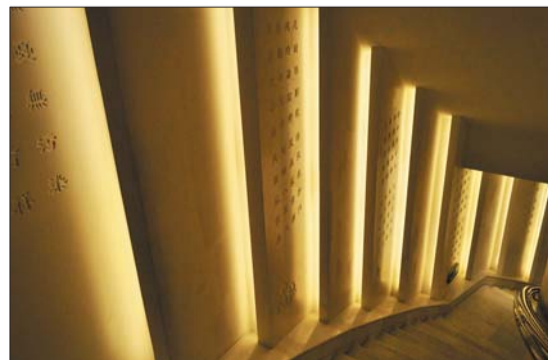
优秀奖 作者 李睿晖