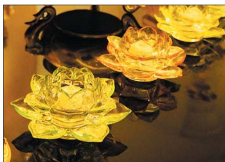
三等奖 作者 冯照 奖励价值150元奖品