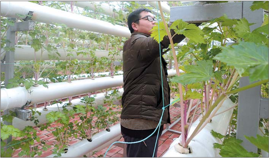
当地培育的马家沟粉芹品种，芹菜梗呈粉色。

岛琴园现代农业有限公司的负责人李春波介绍，随着网络的普及，目前马家沟芹菜的销售除了进商超之外，网售也成为重要的销售渠道，今年大部分菜农的芹菜是实体销售和网络营销相结合。