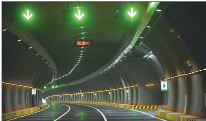
限速标识时刻提醒驾驶员注意交通安全。