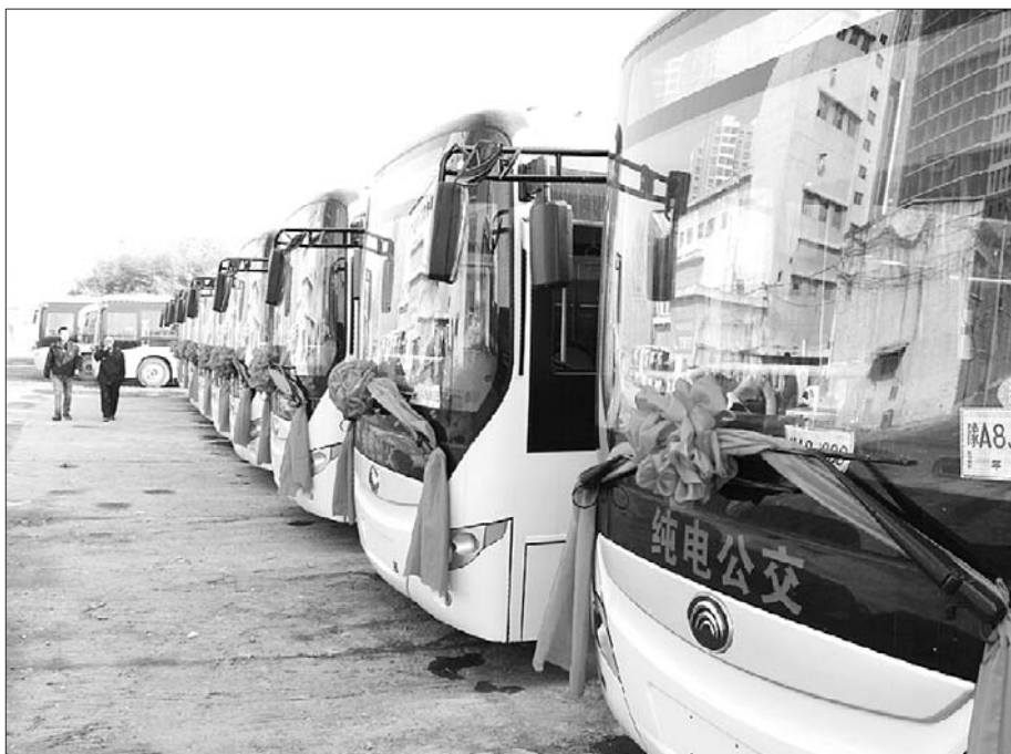
12辆电动公交排成一排。本报记者 庄子帆 摄

济宁正义公交公司总经理付正义介绍,新购置的这12辆纯电动公交车用于更新201线路上的公交车。纯电动公交车2个小时即可充满电,一次行驶里程为150至160公里,也就是说,一