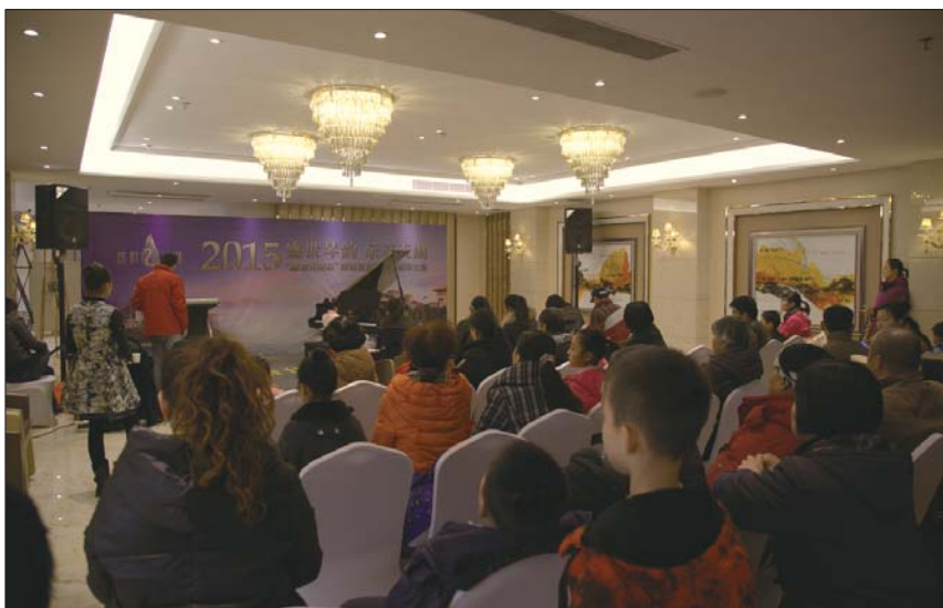
赛事吸引不少市民的积极参与。