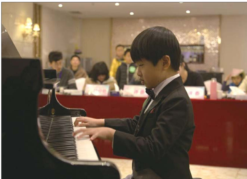
图为参赛小选手认真弹奏。