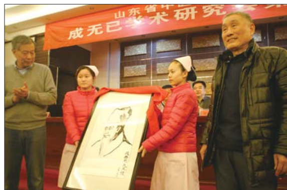
成无己画像揭牌仪式。

刘德勇表示,成无己学术研究会成立一年来,北上内蒙古、北京挖掘成无己的生平事迹及学术思想,南下河南南阳医圣张仲景故里考察与成无己相关资料。