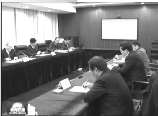
▲新闻联播报道德州市长被约谈一幕。(视频截图)