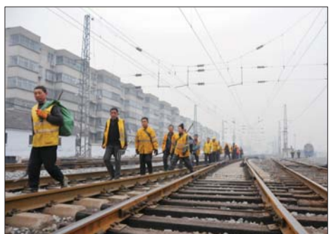
起早贪黑,线路工每天都忙忙碌碌。