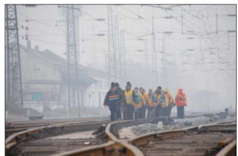
线路工在铁路线上查看轨道。