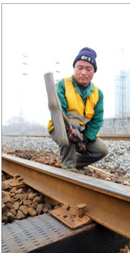
线路工往枕木上砸道钉。