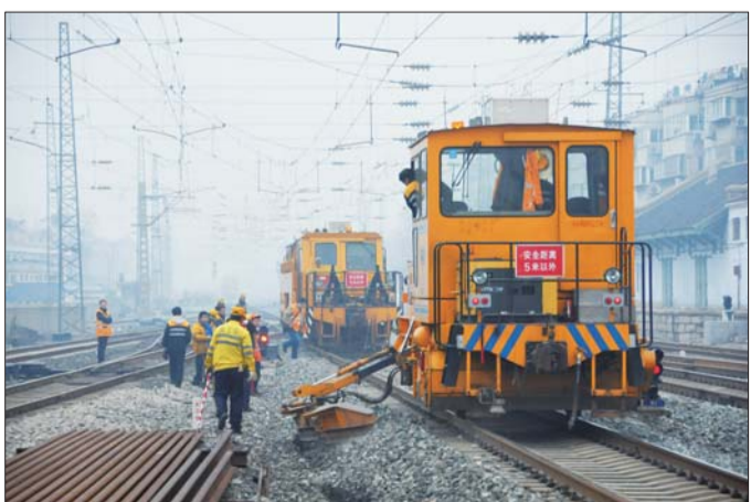
养路机械进行维修作业。