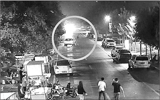
3 王某驾驶车辆将牛某撞飞。