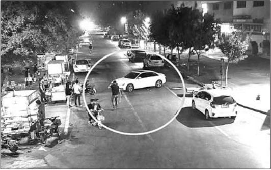
2 王某发动车后掉转车头,追向几名打人者。