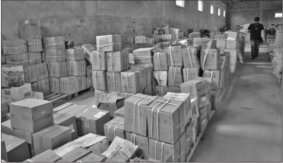
仓库内堆满了各种假冒品牌的发动机配件。

省内多个小厂子购进汽车发动机配件,然后进行销售。在逐步掌握了部分证据之后,民警于9月15日对位于天桥区黄岗工业园四区“济南某汽配商贸有限公司”仓库进行突击检查。民警发现一个面积非常大的仓库内,堆积着各种发动机的配件,既有真品也有假冒商标的劣质配件。