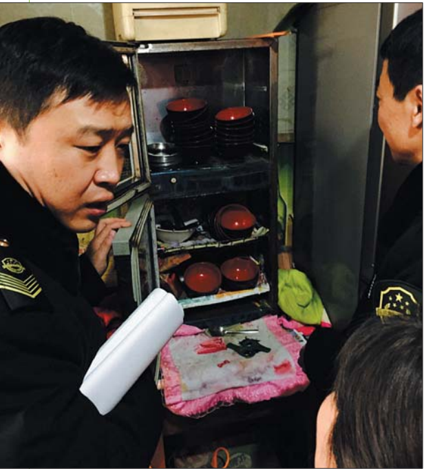
食药监局执法人员对部分餐饮企业进行食品安全检查。