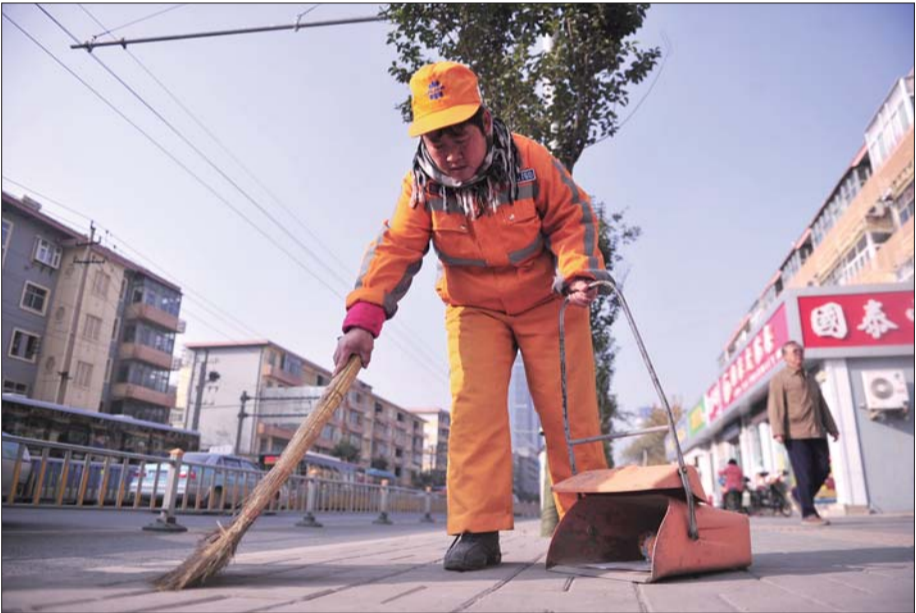
和平路在环卫工人的打扫下,路面非常整洁