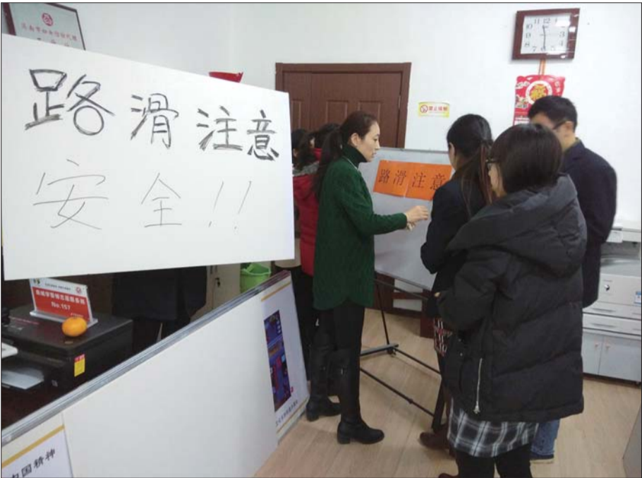
中创开元山庄制作安全出行提示牌。

为确保安全社区建设开展起来、进行下去,街道党工委把安全社区建设摆到重要的突出位置,定期调度工作进展情况,及时掌握推进过程中遇到的各种困难和问题,积极克服办事处各项工作头绪多、任务重的实际困难,在安全社区建设上舍得花精力、投资金、配人员,先后投入自有资金700余万元用于安全社区建设。比如,投资近100万元建立了社会治安综合治理和视频防控网络监控中心,实现了对所有重点区域24小时监控;累计投入30余万元对辖区电气线路存有安全隐患的居民住房进行了整治,并在2016年列出200万元预算用于危旧房屋修缮。