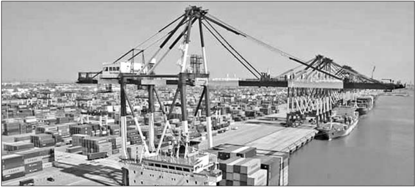
本报记者 孟敏 任磊磊 青岛港在吞吐货物。(资料片)

面临如此严峻的进出口形势,山东的外贸企业如何应对?目前,我省进行外贸备案的企业有近8万家,他们经历了怎样的故事?人民币贬值预期加大,这对主营外贸的企业将带来什么影响?