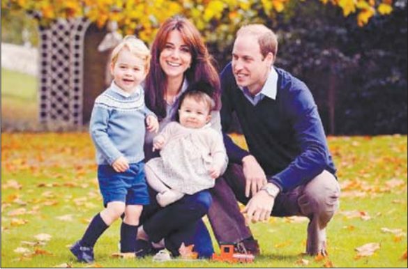
威廉王子一家的合影登上今年的英国王室圣诞贺卡。

子中,大多数家长靠接济支付入园费用。而威廉王子夫妇在伦敦居住的肯辛顿宫附近,幼儿园收费一般在每年1.5万英镑以上。 按照英国王室先前传统,王室成员小时候一般不上幼儿园,而是接受私人教育和辅导。不过,威廉王子小时候就由母亲黛安娜王妃安排上了普通幼儿园。英国媒体评论,威廉王子夫妇安排乔治王子上平价幼儿园,似乎是在践行他们自己的理念,即应该让乔治王子尽可能接受与普通孩子一样的成长。 据新华网