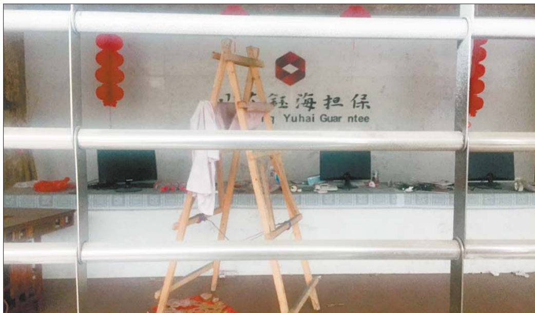
一年前还红火的一家投资担保公司,如今早已关门。

记者随后还询问了泉城路山东轻工大厦里的一家投资担保公司,该公司的一位工作人员表示,公司还在正常营业。记者前后重访了11家投资担保公司,最后仅找到这一家还在营业。不过,记者发现,该公司名的后缀已不是投资担保公司,而变成了其他性质的公司。