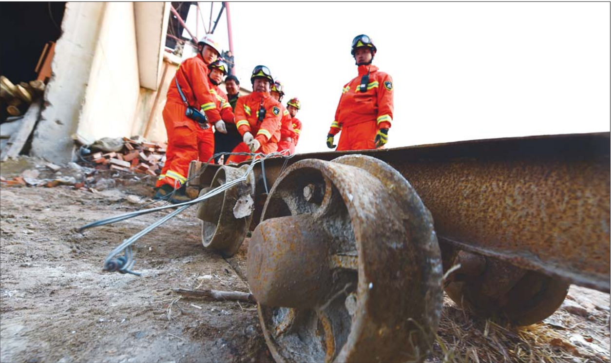
12月26日,山东平邑石膏矿坍塌事故救援工作加速推进,参与救援的临沂消防官兵在清理井口。新华社发