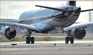
日本喷气式支线客机MRJ

据新华社专电 日本三菱飞机公司24日宣布，日本第一款国产喷气式支线客机MRJ的交付时间将推迟一年左右。三菱飞机发现MRJ的主翼强度不足，需要改造和试验。 三菱飞机原计划2017年4至6月间，向全日空交付首架MRJ，推迟之后交付时间预计为2018年下半年。 MRJ为“三菱支线喷气客机”的英文单词首字母，由日本三菱重工旗下三菱飞机公司研制，为双引擎喷气式支线客机。它分为MRJ90和MRJ70两个系列，分别为90座级和70座级。 上月11日，首架MRJ客机在日本爱知县名古屋首次试飞。MRJ迄今完成3次试飞。根据对试飞数据的分析和参考美国技术人员意见，三菱飞机认为有必要对研发计划做出整体上的修改。 三菱飞机副社长岸信夫24日告诉媒体记者，MRJ的主翼强度不足，无法获得国土交通省关于机体安全性的“型号认证”。按他说法，MRJ试飞没有问题，但“当初的设想有过于乐观之处”。 三菱重工2008年决定研制MRJ并成立三菱飞机公司。三菱起初希望这款客机2011年首飞，但是由于修改设计等原因，进度一再拖延。首架MRJ去年10月建造完成。 共同社报道，此次延期是MRJ研发计划第6次延期，交付计划第4次延期。MRJ11月首次试飞成功后，三菱飞机曾希望海外营销取得进展，但接连出现的延期可能带来负面影响。