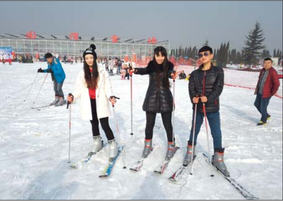
市民在冰雪节上玩耍。

滑雪场开门后,市民鱼贯而入,前台收费处一度排起了长队。香草园滑雪场今天上午迎来了入冬以来的第一批游客高峰。 记者看到,滑雪场配备的娱乐项目非常丰富,有狗拉雪橇、雪地迷宫、马拉爬犁、滑雪橇,胆大的市民还可以体验雪上自行车、雪上坦克、儿童滑雪车等。据介绍,雪场共有30多种娱雪设备,可以让每位游客都能找到自己童年的乐趣。 据香草园相关负责人介绍,开业第一天滑雪场白天场(早上9点到下午5点)就迎来了近两千名市民参与。而且雪场还有夜场时间,可以视客流量适时开放。而整个雪场可以同时容纳三千人游玩,最大接待量为五千人,市民可以放心