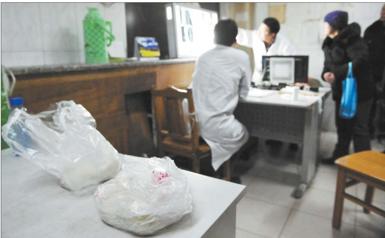
已经午夜了,而他们的晚饭还没有吃,放在桌上早已冰凉。