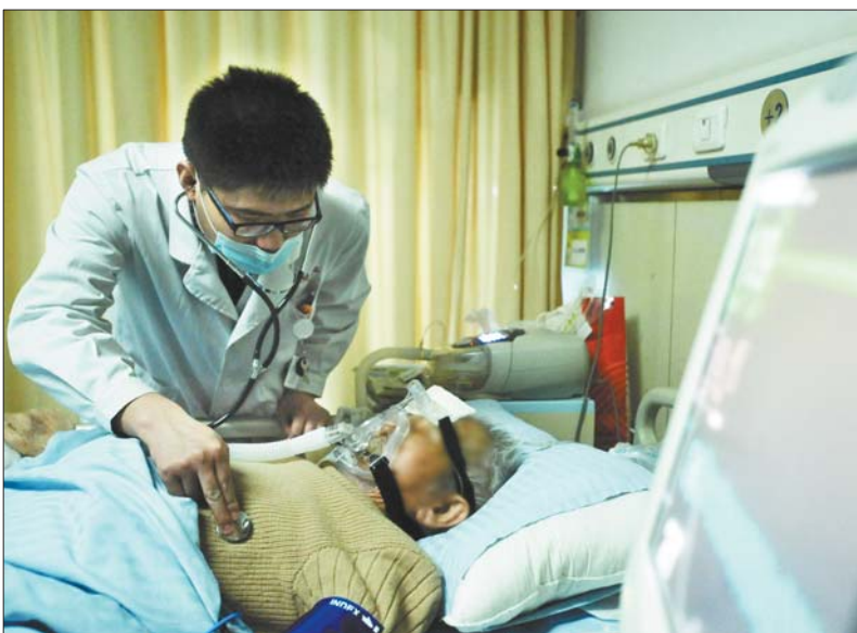
连大夫在急诊病房为老人检查血氧饱和度低的原因。

没有病人时两个人也很紧张,大厅一有大动静或灯光她们就赶快从护士室出来,看看是不是救护车送病人来了,这都成了条件反射了。