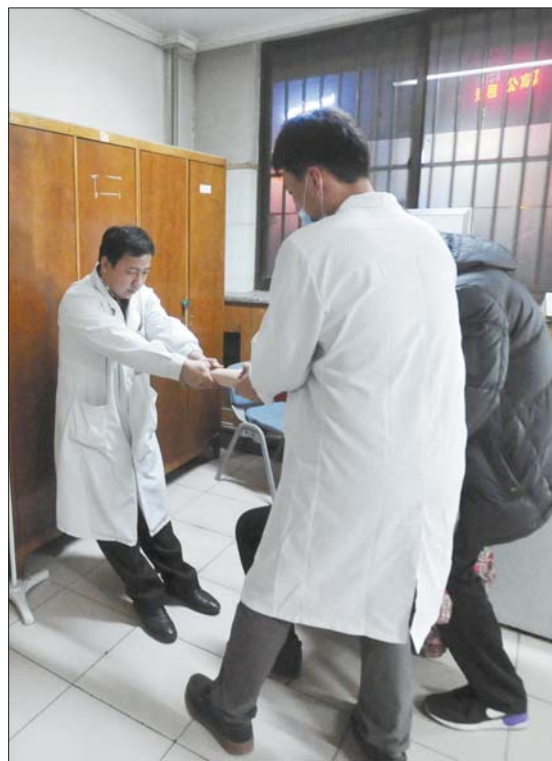
骨折复位既是技术活也是力气活,几个病人下来,管医生头上有了汗滴。