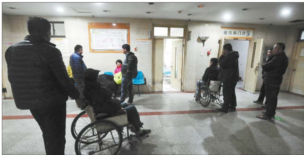
晚上十点多,多名患者在骨科急诊室外排队等待就医。