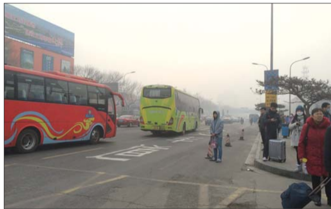
市民在长途汽车站遭遇打车难。

宋师傅介绍,其实他们在西客站平均一个小时才能接到一个活,虽然同样的时间市区能接两三个,但很多的哥都选择在节假日、周末往西客站跑。“接大活的可能性比较大,一趟能挣四五十,顶市区两三个活,而且不堵,跑着舒坦啊。”宋师傅说。