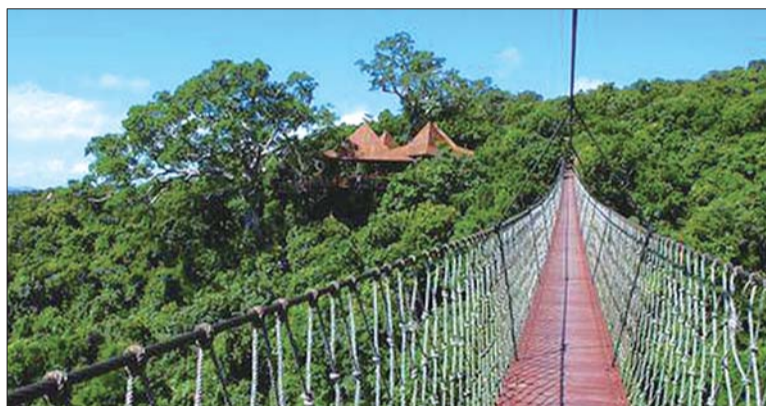
亚龙湾热带天堂森林公园