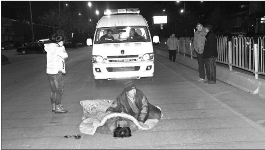
事故现场,老人当场死亡。

本报济南1月11日讯(记者 张泰来) 11日早上5点32分,天还没亮,在济南市天桥区无影山北路,一名外出晨练的老太太沿机动车道行走时,被一辆黑色轿车从背后撞击,“飞”出二三十米远后坠地,医疗人员赶到后发现老人当场身亡。记者了解到,入冬至今已发生数起老人摸黑晨练被撞事故,交警提醒老年市民外出晨练一定要注意安全。