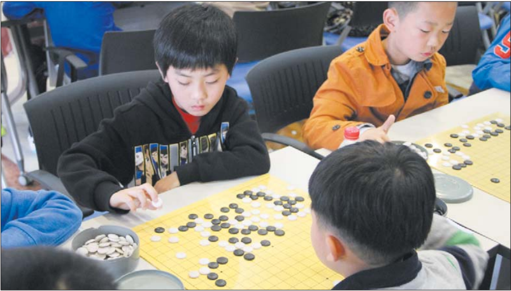
小棋手在参加训练