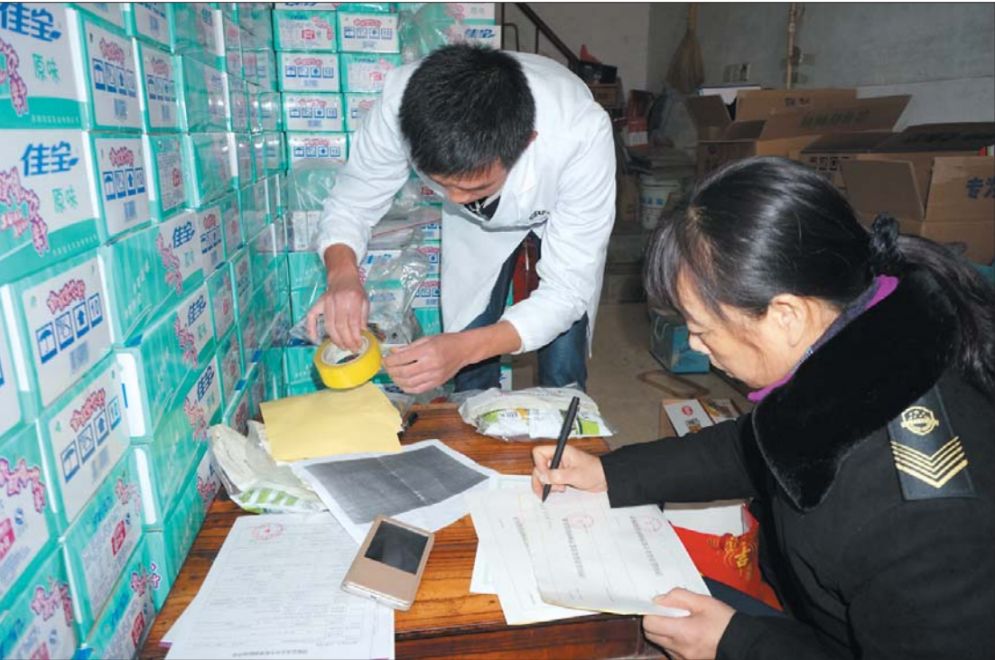
食药监局工作人员与第三方检测机构人员在抽检食品。