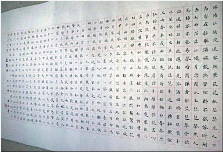
▲孙和平小楷书法作品。