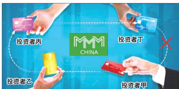
整个过程不会产生价值，因此整个资金链随时有可能断裂。