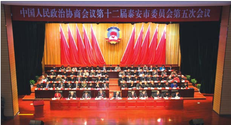
17日上午,市政协十二届五次会议开幕。

本报泰安1月17日讯(记者 王世腾 杨思华) 17日上午,政协第十二届泰安市委员会第五次会议开幕。来自各党派团体和各族各界的政协委员聚集一堂,谋创新之举,建睿智之言,献务实之策。