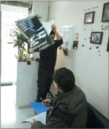
执法人员责令美发店摘掉“价格调整表”。

接到市民对此的举报后,济宁市价格监督检查局与任城物价局成立调查小组,他们调查发现,“济宁美发管理协会”并没有在济宁市民政局和工商联等有关部门登记备案,不属于合法组织。此外,其召集美发店主统一定价的行为,或涉嫌违反价格法。 济宁市价格监督检查局相关执法人员说,美发店根据自身店铺规格不同、手艺不同,经营者自行涨价属于正常的市场行为,而这种以协会为名义的集体涨价,涉嫌违反价格法规定。“经过我们调查发现,有些小型美发店属于被迫涨价,他们虽碍于美发协会的压力贴上了统一的价格表,但并未按照这类价格表执行。我们根据情节不同对这些美发店分别进行了规范。”执法人员说,他们对济宁城区百家美发单位展开调查,要求其撤下已张贴的济宁美发管理协会通知,抵制价格违法行为。而对于这个并无备案的美发协会,目前正在按法定程序调查取证。 19日,记者调查市区多家美发店发现,美发协会的通知均已不再张贴,但很多店仍在执行新上涨的价格。