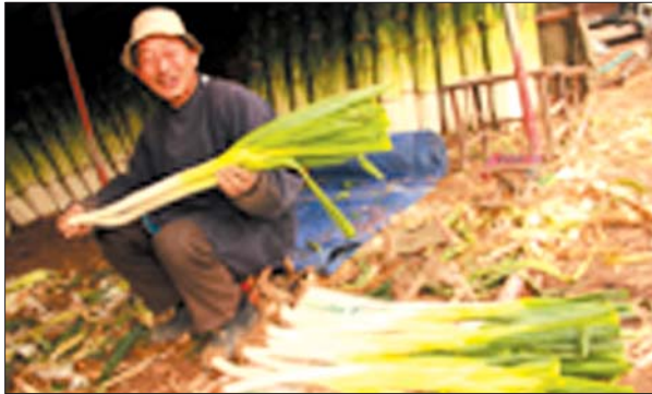
葱农在剥葱装盒(资料片)

“为确保大葱初始交易价格监测的科学、客观、准确,我们物价局依据相关法规制定了价格监测实施方案,并建立了20人的专项监测队伍,在大葱主产区田间地头、大葱交易市场、大葱交易集散地设立20个监测点,自11月16日至12月31日,进行了为期45天的大葱初始交易价格监测。”章丘市物价局局长崔克诚告诉记者。