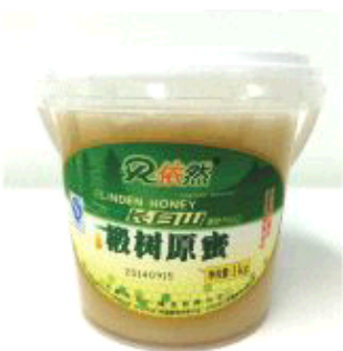
依然椴树原蜜 市场价58元 码帮价50元

椴树蜜中葡萄糖含量在40%左右,果糖含量在30%左右,酶值在12—20之间,还有多种维生素和无机盐、有机酸酶,有促进人体生长和活力的生物素,比一般蜂蜜更能补血、润肺、止咳消渴、增加食欲和止痛等多种作用。另外,椴树蜜本身具有特殊的防腐作用,是制造中成药丸的主要原料。