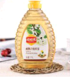
嗡嗡乐成熟洋槐蜜 市场价108元 码帮价65元