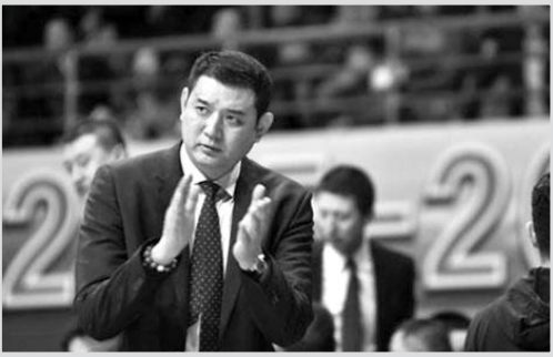
换了身份，大彬将重新踏进省体。

人的身份来到省体，成为山东篮球，成为自己昔日弟子的对手。然而世事无常，这一天真的来到了。赛场无兄弟，双方首次交锋，已经证实了竞技的残酷，二度交手，依旧先礼后兵。