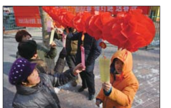
社区居民们在看灯笼上的灯谜。 另外,居民通过邻居、社区微信群等方式得知在广场上有猜灯谜活动,一到现场就迫不及待的加入到猜谜大潮中。

本报1月26日讯(实习生 胡明) 26日9点半左右,在张店梅苑小区活动广场上,一场别开生面的“迎新春,猜灯谜,送春联”活动就要拉开序幕,不少居民提前半小时就等在现场。 10点左右,活动正式开始,居民迫不及待的猜了起来。“这个答案是西瓜,谜面上的白色一条条说的是西瓜霜,穿的绿衣裳是西瓜皮,里面红色瓢说的是西瓜瓢。”一位小市民指着灯谜开心的向爷爷说道,他已经在3分钟内猜对两个谜语,心中的成就感油然而生,虽然脸颊已经被寒风吹得有些泛红,但脸上一直挂着开心的笑容。