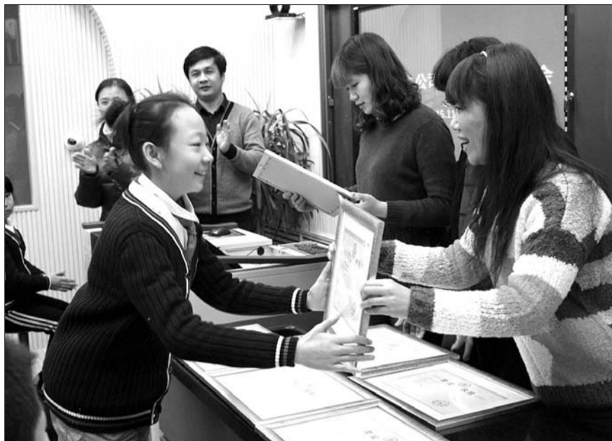
2015年11月26日，济南市纬二路小学为“学生公司”颁发“营业执照”。能够如此创新教学方式，正是基于“小班化”教育的优势。(资料片)