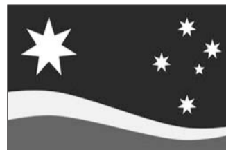
此次海选胜出的“南方曙光旗”