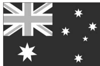
澳大利亚现在的国旗