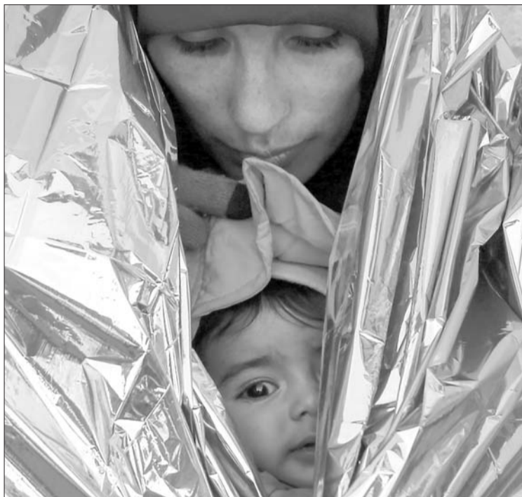
20日,在塞尔维亚南部普雷舍沃一处火车站,一名难民和她的孩子裹着毯子等待开往克罗地亚的火车。

丹麦议会26日通过一项有争议的法案,授权当局没收入境难民携带的现金和贵重物品,用于支付他们在寻求庇护期间的食宿费用。美国有线电视新闻网(CNN)认为,丹麦此举旨在回应国内民众对难民潮的担忧,阻止难民持续涌入,同时也表明欧洲国家整体上对难民的态度趋于强硬。