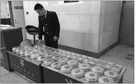
济南空港口岸截获大量非法入境燕窝。

据介绍,该批燕窝由该旅客自香港购入,未经申报、无检疫审批手续,其声称对旅客禁止携带物法律法规不知晓。现场业务人员对该旅客进行耐心细致的相关法规宣讲后,对该批燕窝做截留退运处理。 根据《中华人民共和国禁止携带、邮寄进境的动植物及其产品名录》规定,燕窝(冰糖