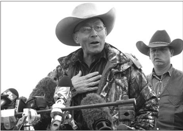
在交火中死亡的罗伯特·菲尼库姆 (资料片)

27日下午,一名“民兵”成员帕特里克告诉路透社记者,一些人已经离开,另一些人仍在“坚守”。稍后,联邦调查局说,8人已经离开保护区,其中3人被捕,包括帕特里克。