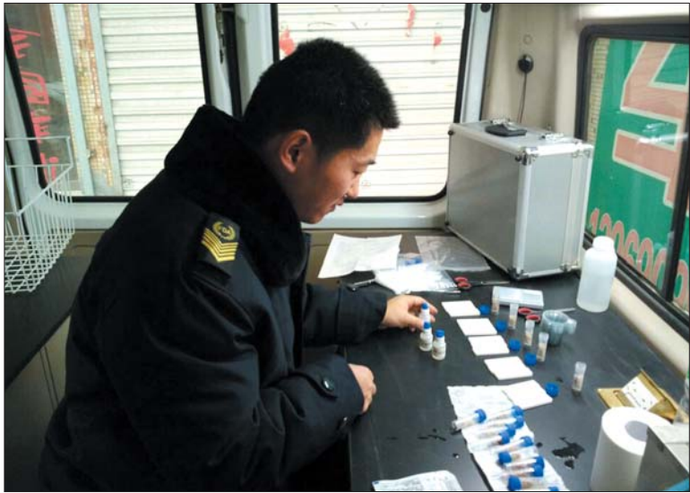
执法人员正在对抽检食品进行快检。